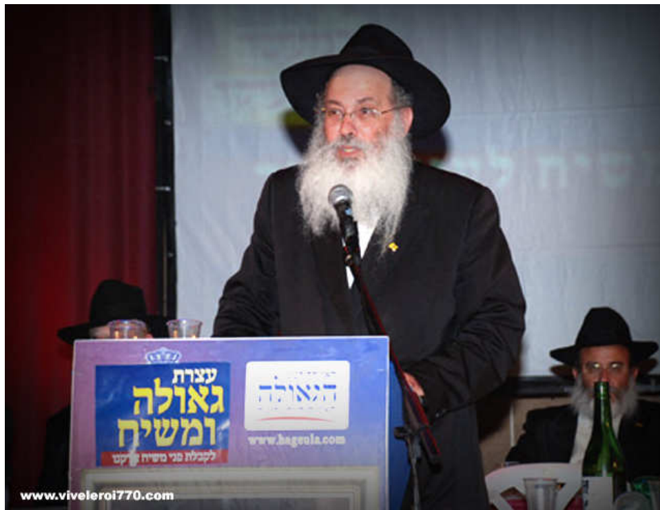
« Tamouz 5771 : Le Rav Zimroni Tsik qui dévoile la Guéoula dans tout Israël ! »