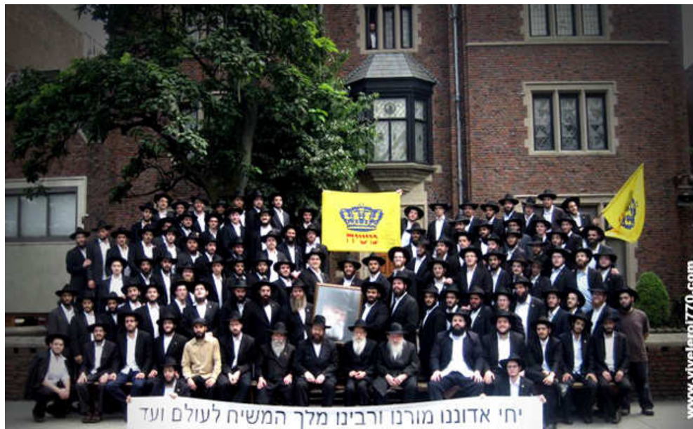
« Tamouz 5771 : Les élèves du Rabbi Roi Machia'h, la fierté du Roi ! »

☰ Résumé du Dvar Mal'hout : Chabbat Matot 5751-1991