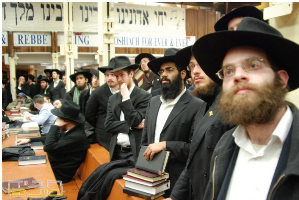
Les élèves de la Yéchiva du 770 à New York, lors de la projection d'un film du Rabbi MHM cette semaine

La Newsletter qui rapproche la délivrance véritable et complète