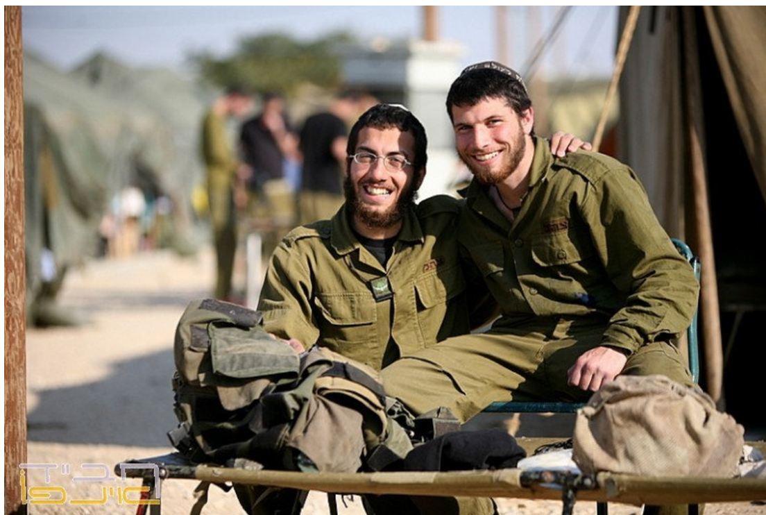
Les soldats israéliens, après trois semaines de miracles rentrent chez eux

Après trois semaines de guerre déclarée, et un cessez-le-feu imposé par le reste du monde, le dernier soldat est sorti de Gaza, mais Guilad Shalit, lui, n'est-il pas un soldat ? Or, il n'est toujours pas rentré chez lui, auprès des siens... Comment peut-on oser déclarer un cessez-le-feu ?