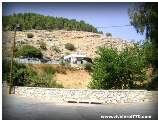
Amouka 5770 : prier avec Rabbi Yonathan pour la Guéoula