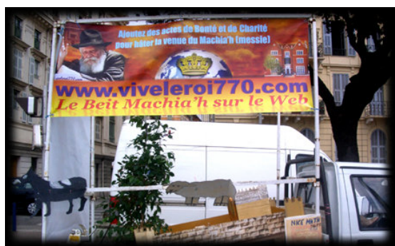
« 5770 : Vive le Roi dans les rues de Nice »