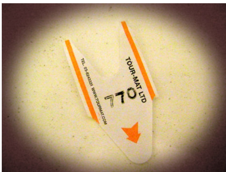
Le véritable ticket du 22 Elloul 5770

Dans le Dvar Mal'hout de cette semaine, le Rabbi Roi Machia'h demande à ce que l'on continue à publier la nouvelle de la délivrance et complète dans les journaux. On peut voir en effet le travail qui est fait à longueur d'année par les 'hassidim 'Habad pour propulser la nouvelle de la Guéoula et l'identité du Roi Machia'h sur toute sorte de supports, flyers, publicité sur les bus israélien, affichage dans le monde entier et plus particulièrement, les articles et publicités dans de prestigieux magazines et journaux.