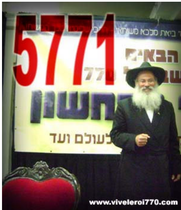
« 5771 : Les Chlou'him qui font bouger la Guéoula Rav Zimroni Tsik (Bat Yam) »