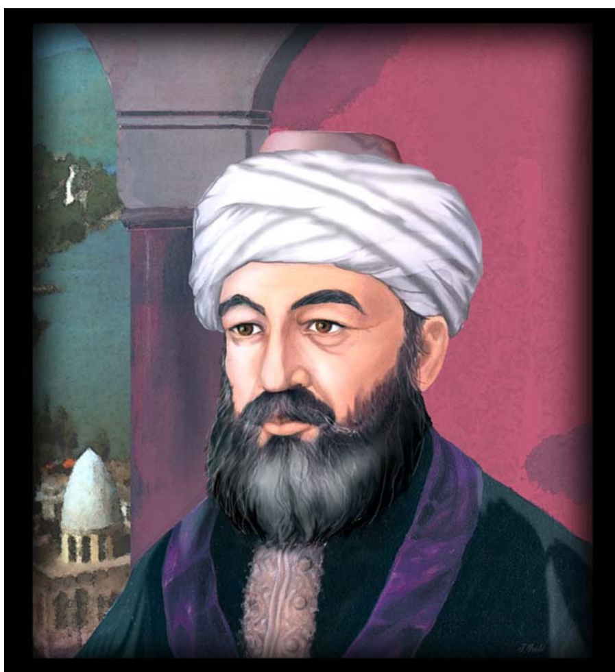
Illustration : Jacky Ria'hi

En hébreu ça se dit : la Achga'ha Pratite ! C'est une notion qu'évoque le Saint Baal Chem Tov, une dimension d'une incroyable précision de plus en plus visible pour celui qui y fait attention. En ce moment, ce qu'il se passe au niveau spirituel, c'est que chacun peut voir, même sans ouvrir les yeux bien grands que D.ieu est présent dans chaque moment de sa vie et qu'Il trace la trajectoire de nos pas d'une manière de plus en plus visible et tangible, au point que chacun de nous peut se dire : c'était pour moi !