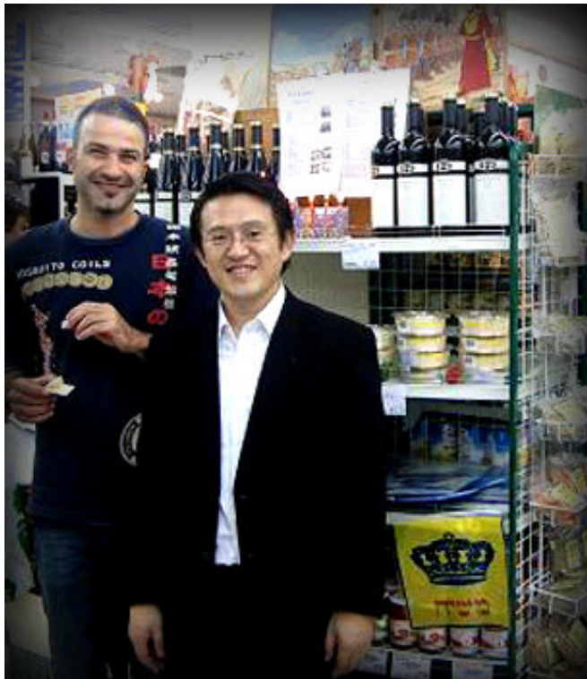
« 5771 : Même les non-Juifs sont prêts pour la Guéoula... »