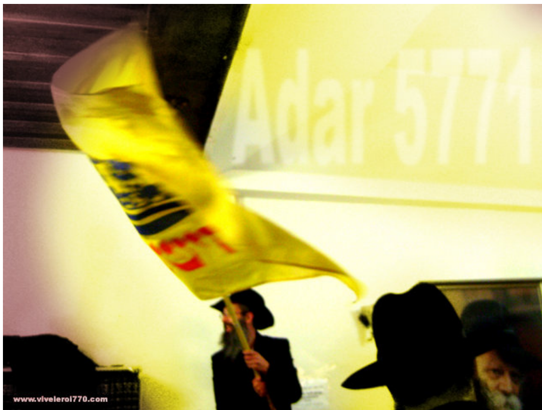
(Dvar Mal'hout Vayikra 5751-1991)

sacrifices, les Pessa'him, et « Nous Te remercions par un chant nouveau, de Ta délivrance, parce que Tu as délivré nos âmes, béni sois-Tu Hachem, qui nous a sauvé ».