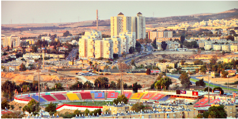
La ville de Beer Sheva